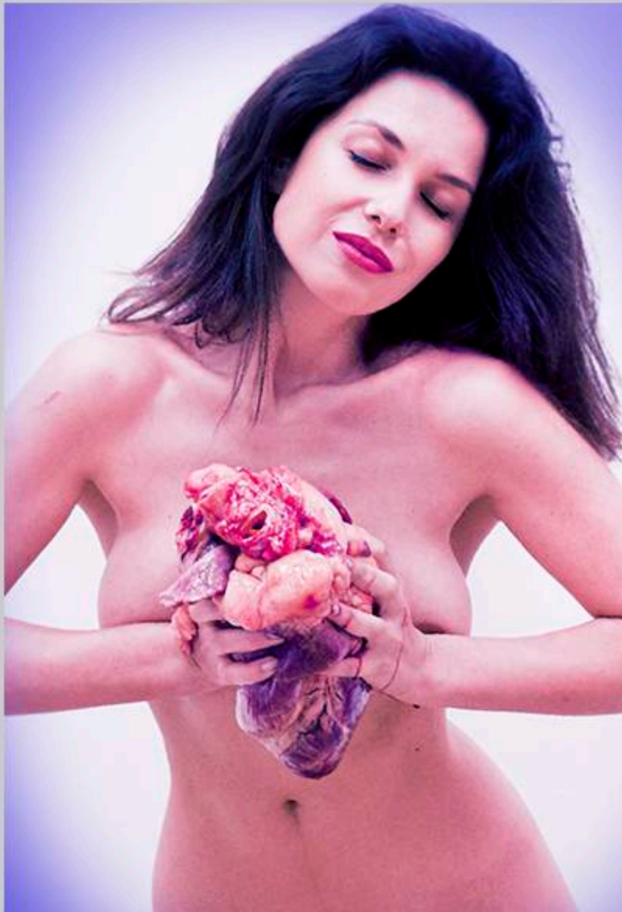
The Serenity PHOTO 120 X 85