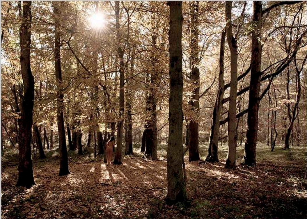
L'hiver 16:03 PM 120X 80 cm