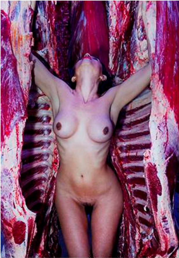
Me inside Me 110x 90