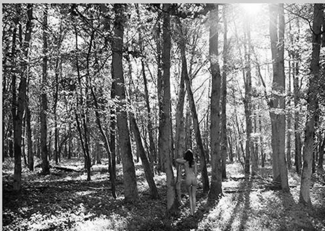
L'hiver 15:59 PM 120 X 80 cm

Women like energy, sensuality, mystery... Body, mind and soul! That's what I see and that's what I like to capture!