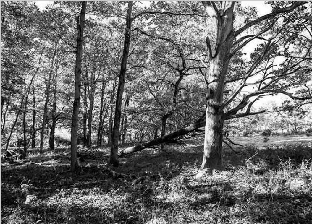
L'hiver 16:05 PM 120X 80 cm