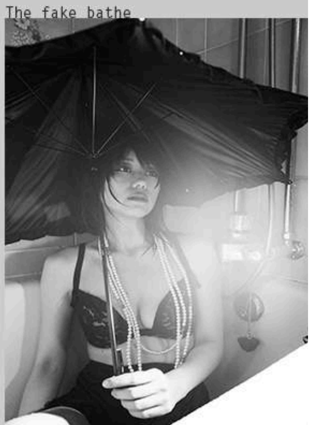
The fake bathe